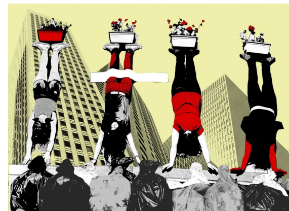
Fotografika, hommage pesniku Srečku Kosovelu (izdelek dijakinj ART in GIM, projekt Dan ustvarjalnosti)

Aranžer – kdor poklicno kaj ureja v skladno, estetsko celoto.