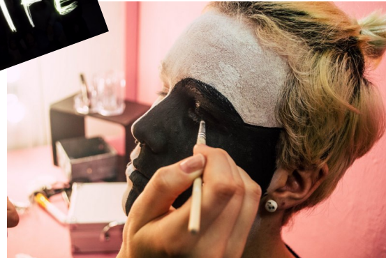
Pustne poslikave (priprave na šolsko pustovanje)