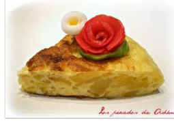
La tortilla de patatas