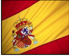
La bandera española