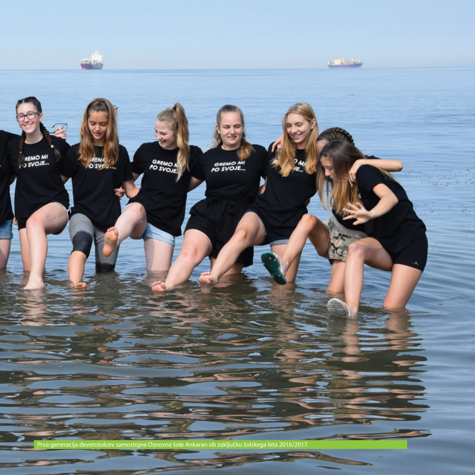
Prva generacija devetošolcev samostojne Osnovne šole Ankaran ob zaključku šolskega leta 2016/2017